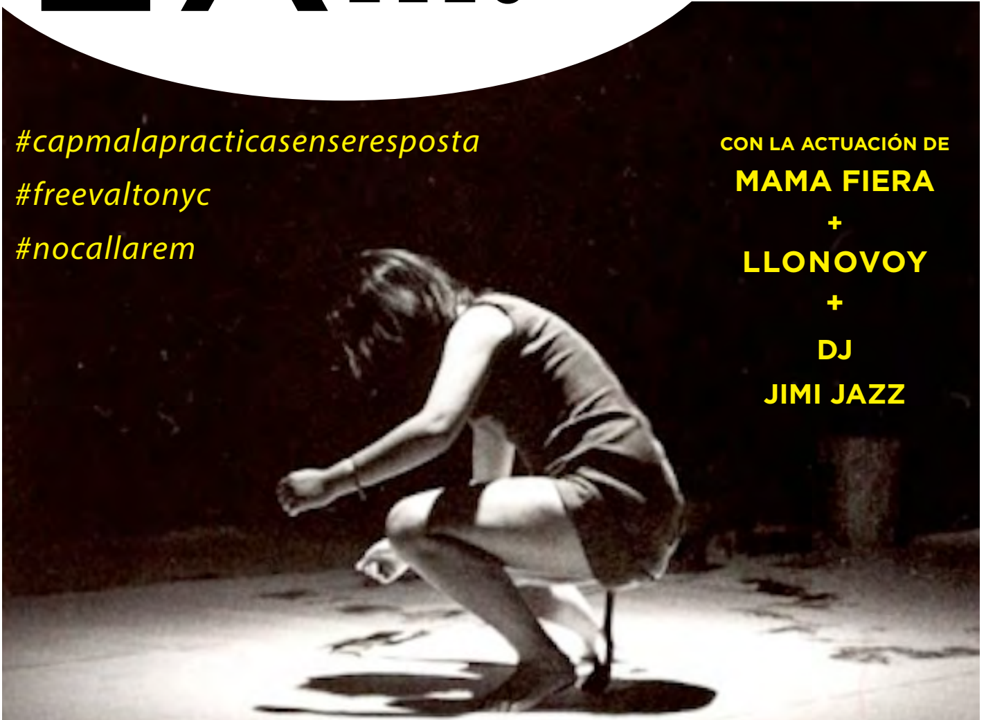
Imatge: Shigeko Kubota. Vagina Painting, 1965